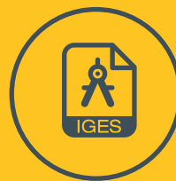
Compara cu CAD